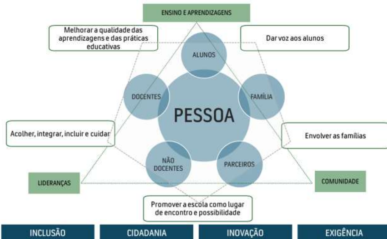
Figura 1: Esquema concetual do Plano de Ação

São as pessoas que dão sentido aos eixos que o programa TEIP define (Ensino e Aprendizagens, Lideranças e Comunidade) e às quais quer responder com as medidas que propomos. Medidas estas expressas em AEI que visam: melhorar a qualidade das aprendizagens e das práticas educativas; acolher, integrar, incluir e cuidar de cada pessoa desta comunidade que é o AE Pedrouços; promover a escola como lugar de encontro e possibilidade: encontro de diferentes sensibilidades, de diferentes culturas e nacionalidades, de pessoas capazes de buscar o bem comum e, nesse sentido, abre a quem nos procura um conjunto de possibilidades de formação, de melhoria, de realização; envolver as famílias, mais do que as receber: são as famílias os primeiros educadores e os primeiros responsáveis pelos filhos que são os nossos alunos e, por isso, os nossos principais parceiros; por fim, dar voz aos alunos, pois, uma escola que se quer inclusiva e que coloca as “aprendizagens como centro do processo educativo”, tem de ser capaz de escutar e envolver aqueles a quem quer “garantir uma educação de qualidade, proporcionando as melhores oportunidades educativas para todos” (PASEO).